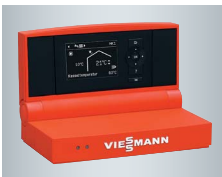
Vitotronic Regelung mit übersichtlicher Menüführung